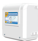
Besturingssysteem optima 4 bar