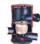
WFF100 wervelfijnfilter Filtre Fin Tourbillonnaire

Un système de collecte, de stockage et de distribution des eaux pluviales pour des besoins qui ne nécessitent pas une qualité d'eau potable (l'arrosage du jardin, le nettoyage, chasse d'eau pour les toilettes, la machine à laver etc...)