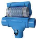
Compactfilter it Compact filtre it

Un système de collecte, de stockage et de distribution des eaux pluviales pour des besoins qui ne nécessitent pas une qualité d'eau potable (l'arrosage du jardin, le nettoyage, chasse d'eau pour les toilettes, la machine à laver etc...)