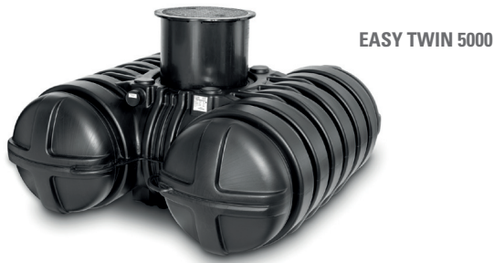
EASY TWIN 5000