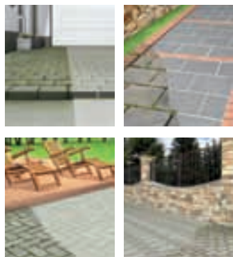
Bus van 2 of 5 L